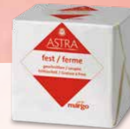
PLT ASTRA FEST GESCHNITTEN Pistor Nr. 18821