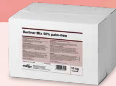
BERLINER MIX 50 % PALM-FREE Pistor Nr. 18828