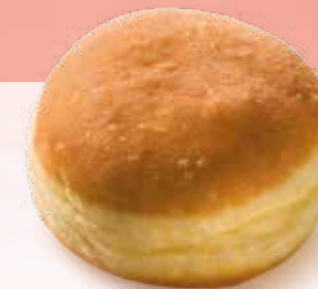
BERLINER OHNE FÜLLUNG Margo Nr. 79