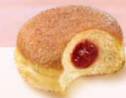
BERLINER GEZUCKERT & GEFÜLLT Margo Nr. 1342