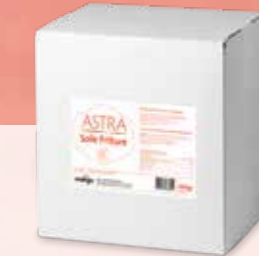
ASTRA SOLE FRITURE Pistor Nr. 11025