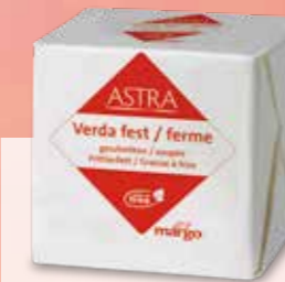
ASTRA VERDA FEST GESCHNITTEN Pistor Nr. 4769