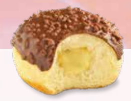
SCHOKO-BERLINER MIT VANILLECRÈME Margo Nr. 1282