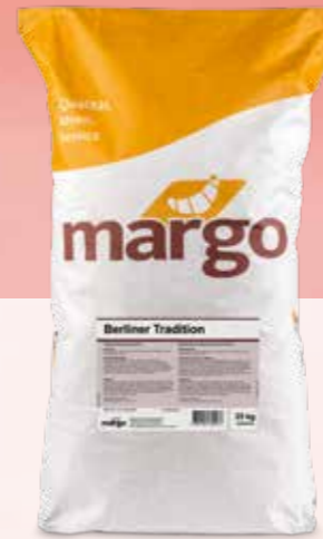
BERLINER TRADITION 100 % Pistor Nr. 4886