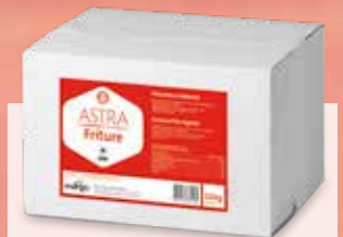
PLT ASTRA FRITURE Pistor Nr. 12738