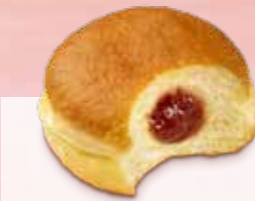
BERLINER GEFÜLLT Margo Nr. 1378