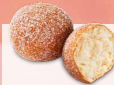
QUARKBÄLLCHEN Margo Nr. 296