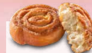
APFELSCHNECKE GEZUCKERT Margo Nr. 277